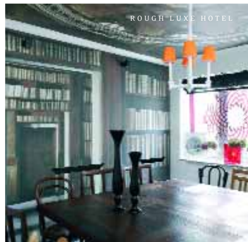
ROUGH LUXE HOTEL